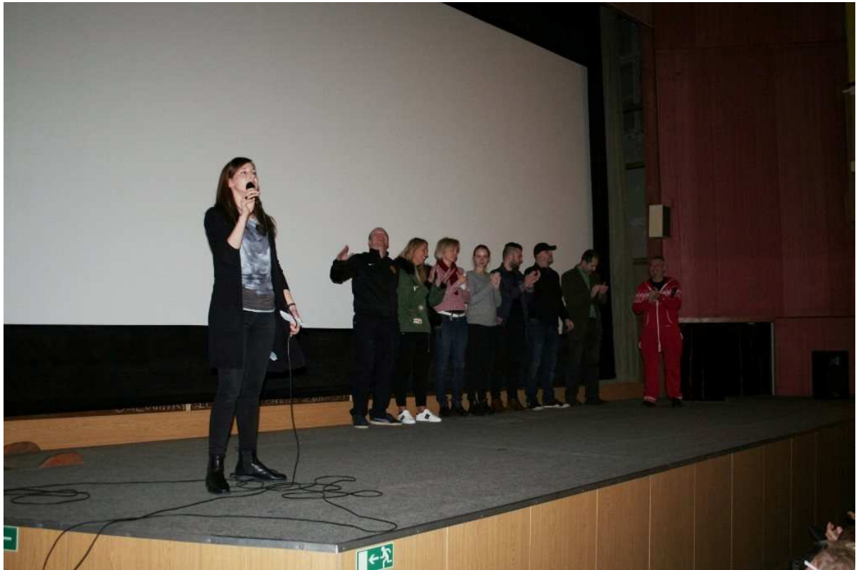
Ze slavností předpremiéry filmu Manžel na hodinu v nymburském kině

Zpracoval: Lukáš Kadava, leden 2017 www.nkc-nyburk.cz